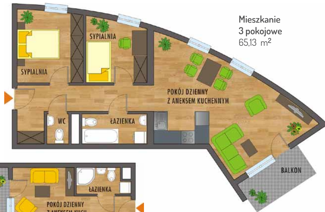
Mieszkanie 3 pokojowe 65,13 m 2