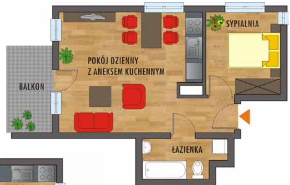
Mieszkanie 2 pokojowe 40,44 m 2