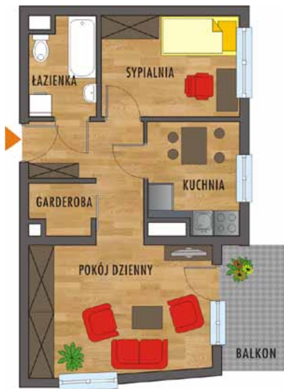
Mieszkanie 2 pokojowe 43,71 m 2