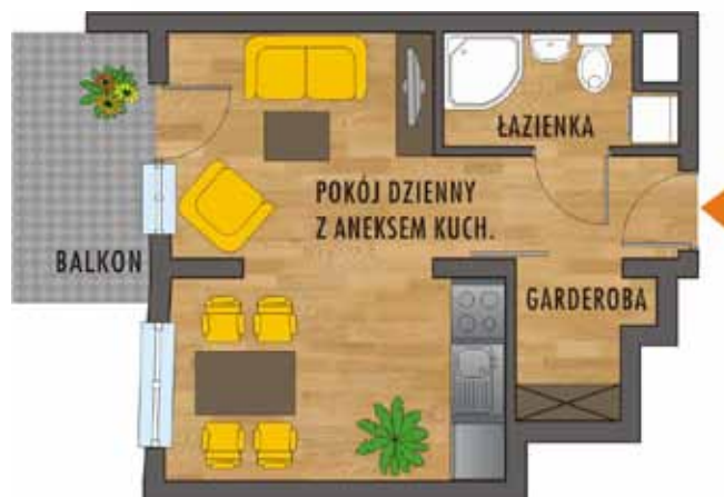
Mieszkanie 1 pokojowe 28,15 m 2