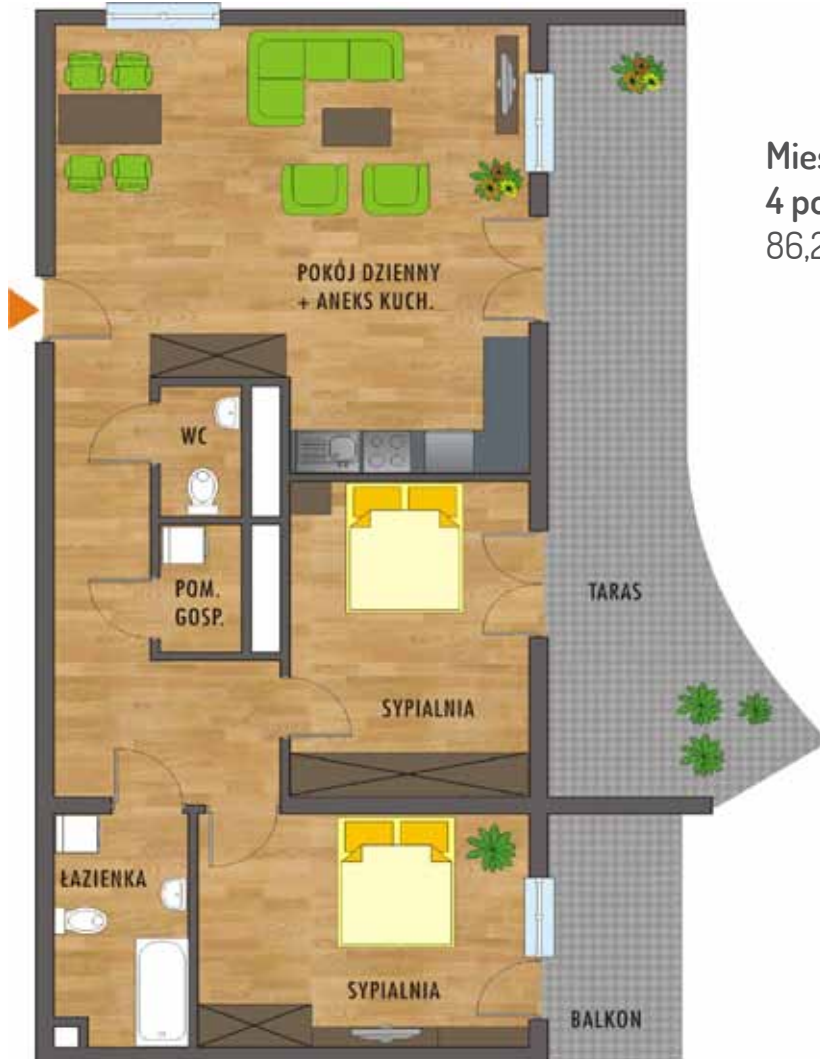
Mieszkanie 4 pokojowe 86,22 m 2