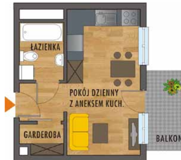
Mieszkanie 1 pokojowe 24,70 m 2